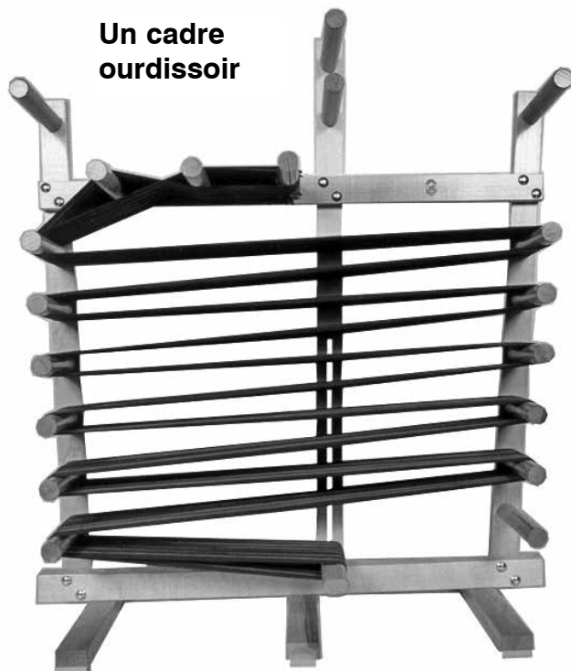
Un cadre ourdissoir

Le métier "Inkle" est un métier très simple et conçu pour le tissage de bandes étroites et fortes. Peut fabriquer des bandes de grandeur maximale de 6" de large par 16 pieds de long. Le tissage est en même temps rapide, silencieux et attrayant. Des articles tels que ceintures, cravates, courroies de guitare, etc. peuvent être tissés en une heure. Des bandes de 6" de large (15 cm) peuvent être faites sur ce métier. En joignant ces bandes, vous pouvez obtenir des coussins, des pièces murales, etc. Le cendrel peut aussi être un excellent cadre ourdissoir, un outil de base pour tout tisserand. Peut ourdir une chaîne jusqu'à 10 verges.