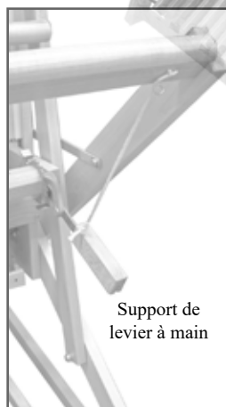
Support de levier à main