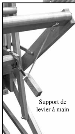
Support de levier à main