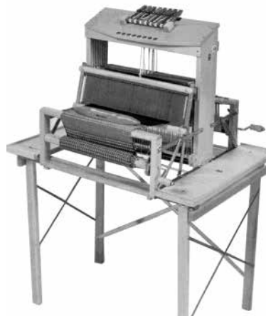
Voyageur 15 3 / 4 " sur une table de Dorothy Table: 6312-0000 260.00$