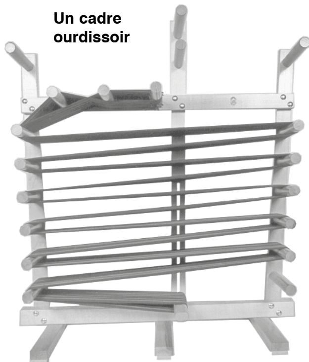
Un cadre ourdissoir

Le métier "Inkle" est un métier très simple et conçu pour le tissage de bandes étroites et fortes. Peut fabriquer des bandes de grandeur maximale de 6" de large par 16 pieds de long. Le tissage est en même temps rapide, silencieux et attrayant. Des articles tels que ceintures, cravates, courroies de guitare, etc. peuvent être tissés en une heure. Des bandes de 6" de large (15 cm) peuvent être faites sur ce métier. En joignant ces bandes, vous pouvez obtenir des coussins, des pièces murales, etc. Le cendrel peut aussi être un excellent cadre ourdissoir, un outil de base pour tout tisserand. Peut ourdir une chaîne jusqu'à 10 verges.