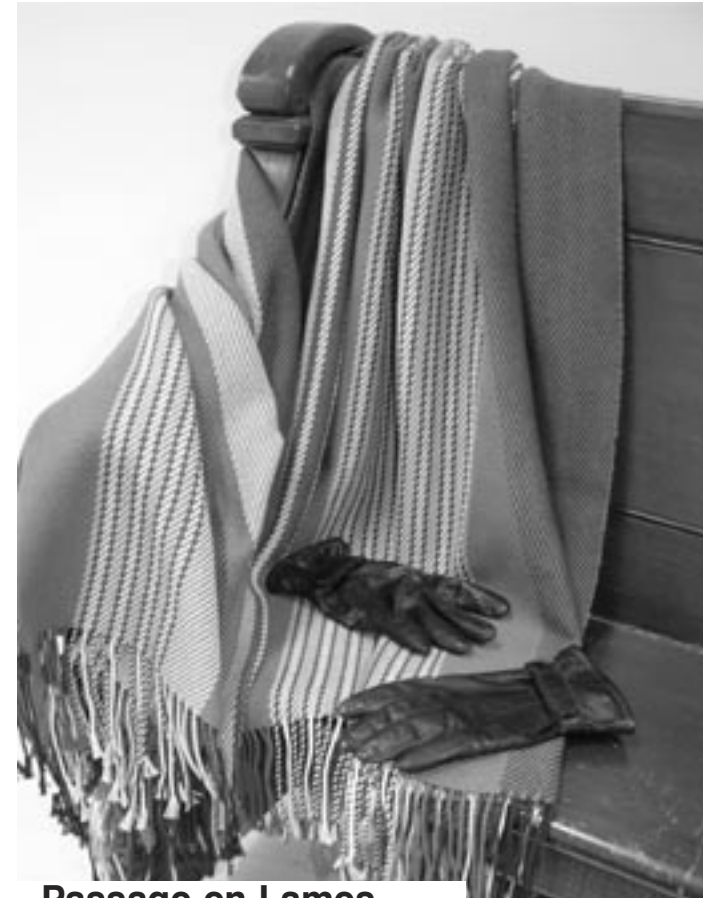
Passage en Lames